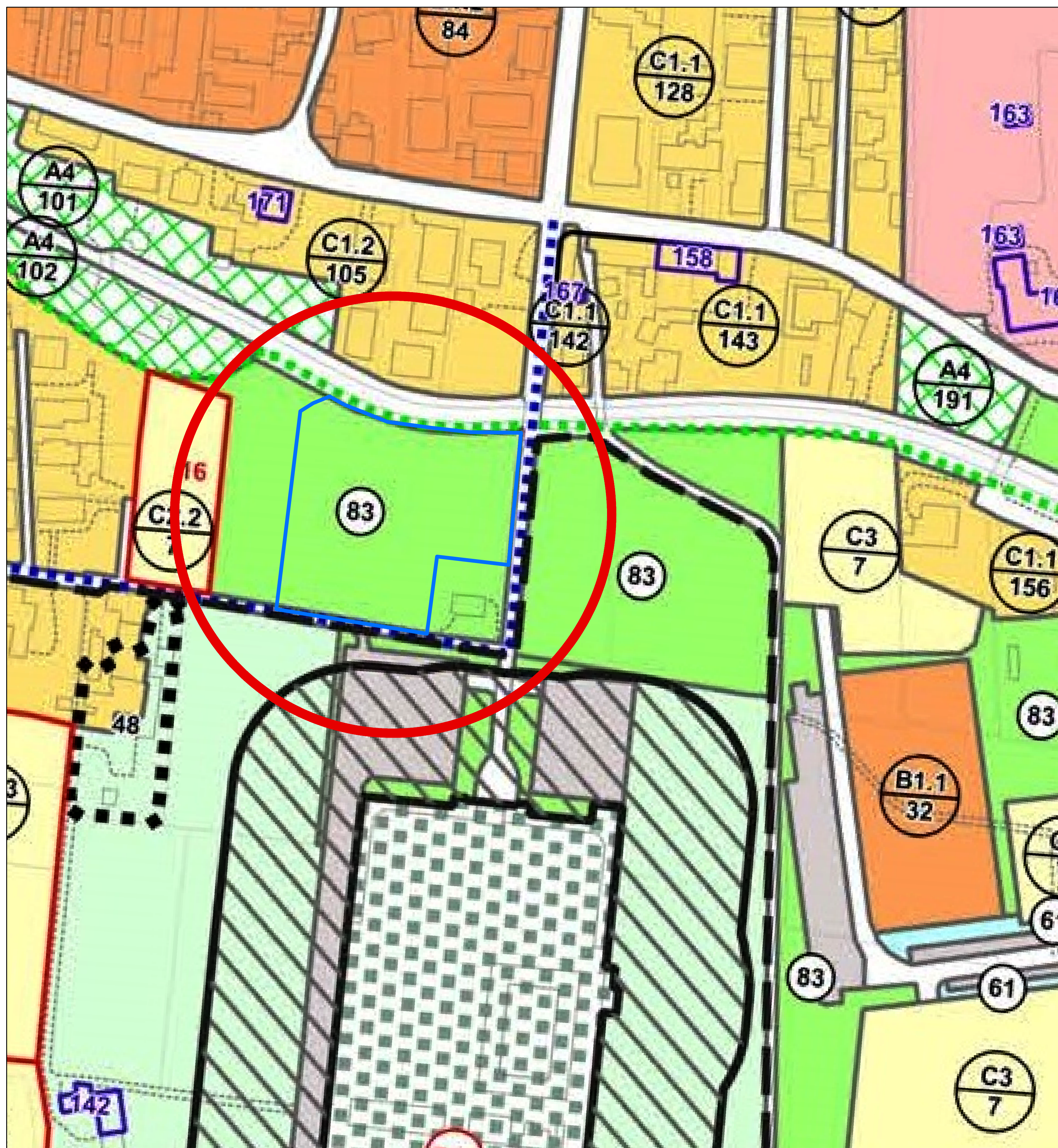
Estratto tav. 1.3 Zonizzazione Stato di fatto - Scala 1:1000