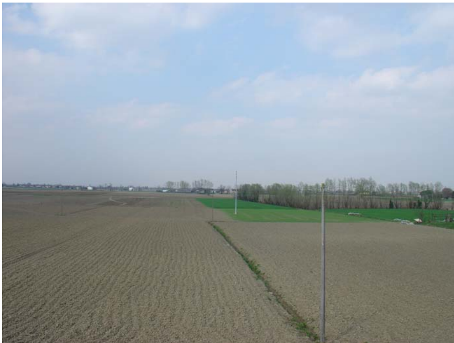
Bonifica dall'argine del Bacchiglione

La scena non ha margini e lo sguardo si perde lungo la linea orizzontale della bonifica.