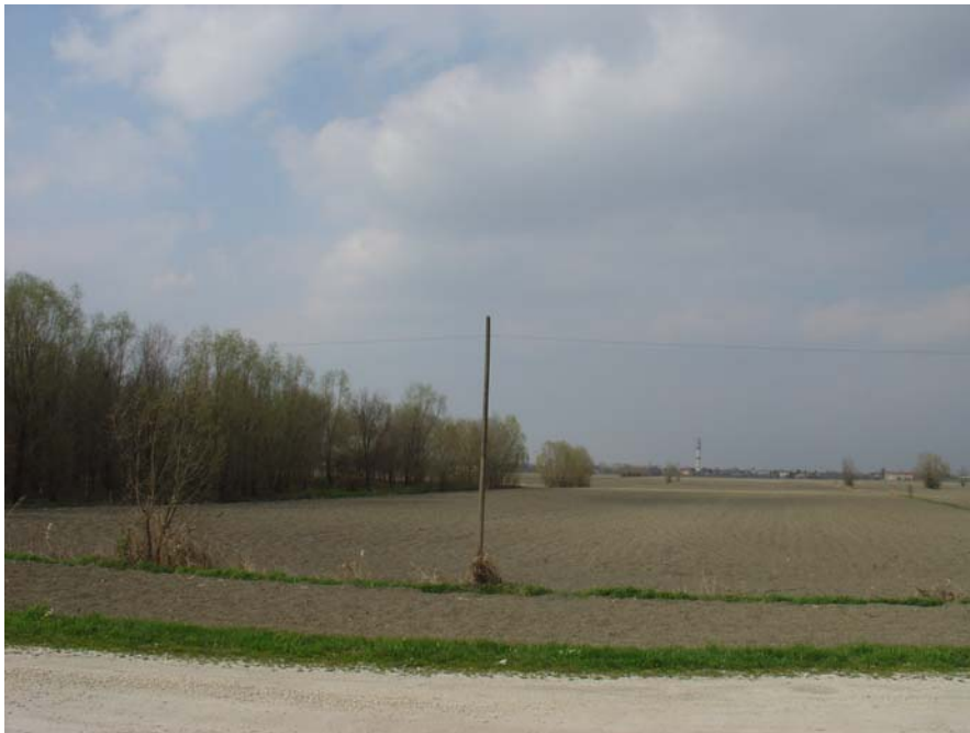
Area delle "comunanze"

Lo sfondo della scena è costituito dall'abitato di Arzergrande.