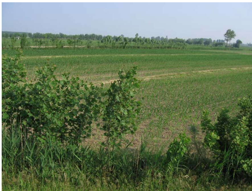
Vista sulla Bonifica "Oltre Brenta"