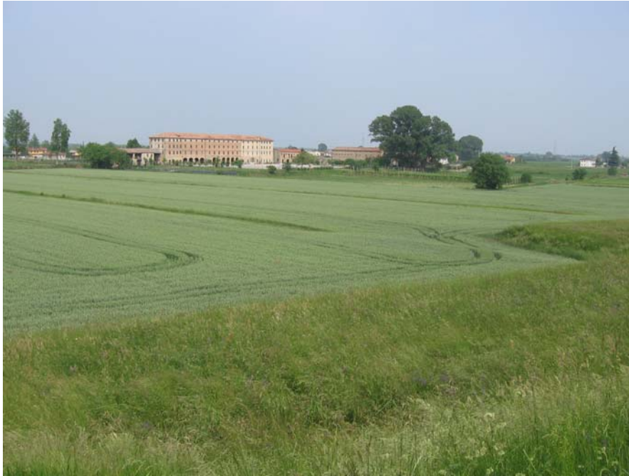
Palazzo Jacur dall'argine del Brenta