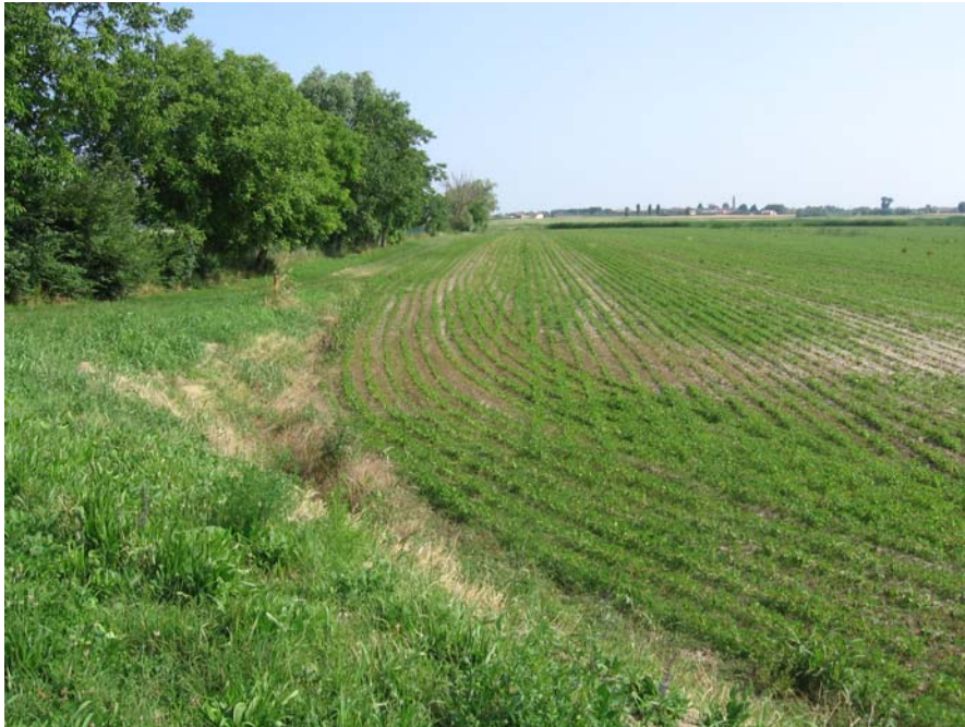
Chiesa di terranova dall'argine del Bacchiglione

La scena è definita sul lato sinistro da una fitta siepe interpodereale, mentre sullo sfondo si legge il profilo dell'argine del fiume Bacchiglione.