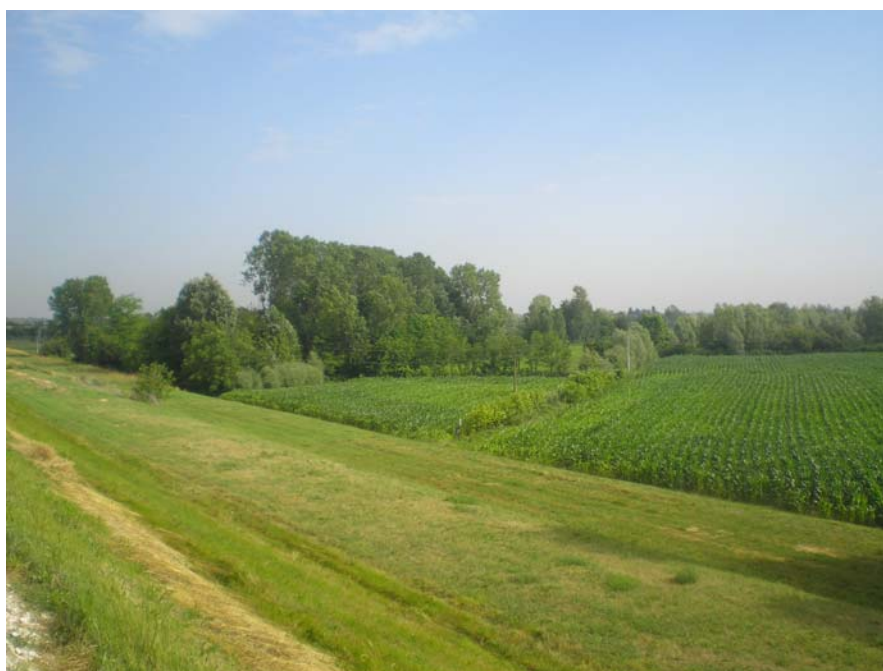
Area umida "brenta Secca" dall'argine del Brenta

Un'area ove prevale l'immagine del paesaggio agrario tradizionale e che rappresenta la Cornice ideale per il Quadro visivo.