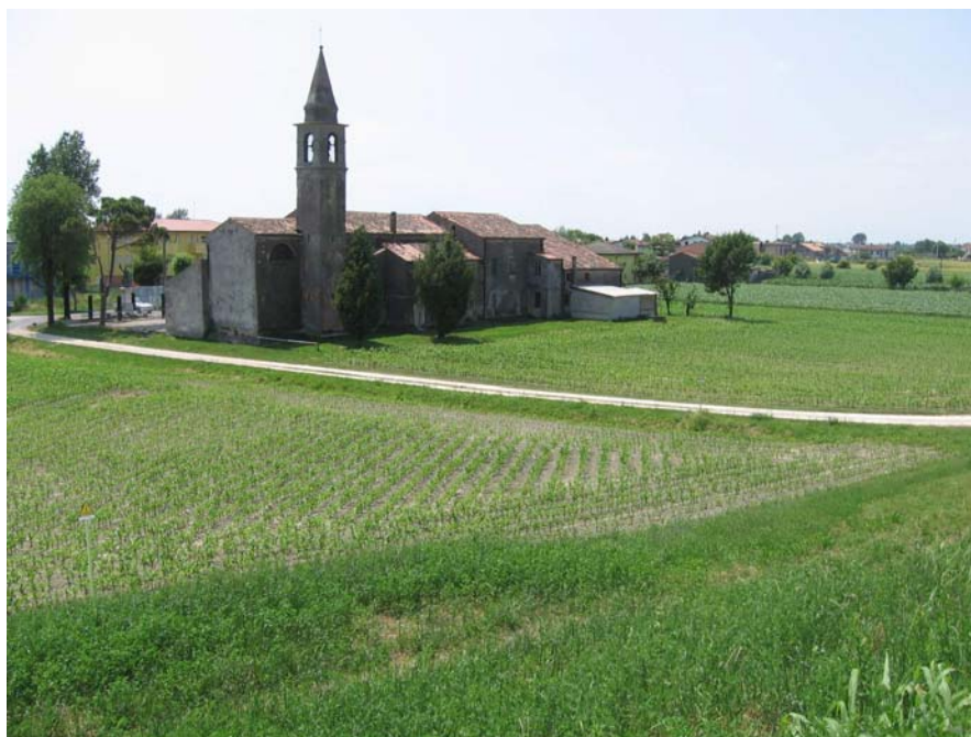
Chiesa di terranova dall'argine del Bacchiglione