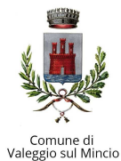
Comune di Valeggio sul Mincio