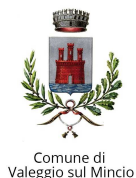
Comune di Valeggio sul Mincio