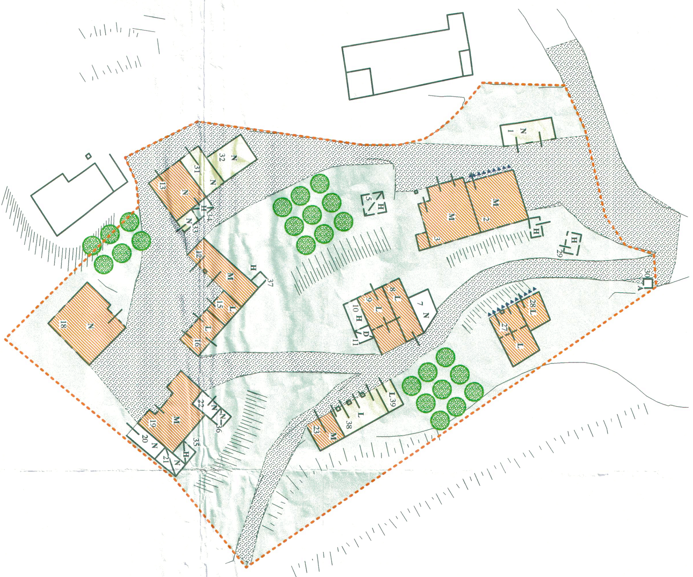
Polacca n° 66