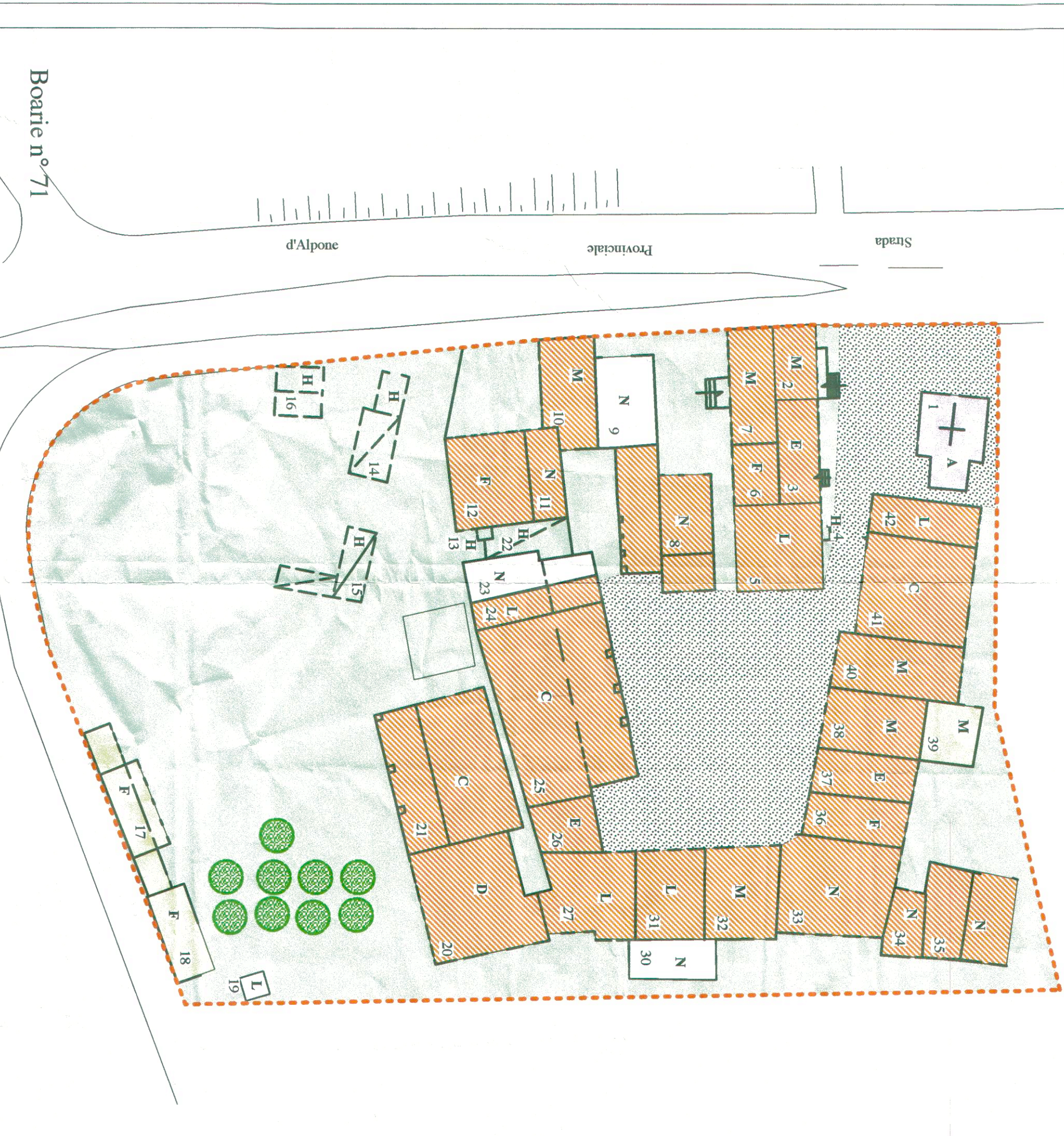
Boatice n° 71