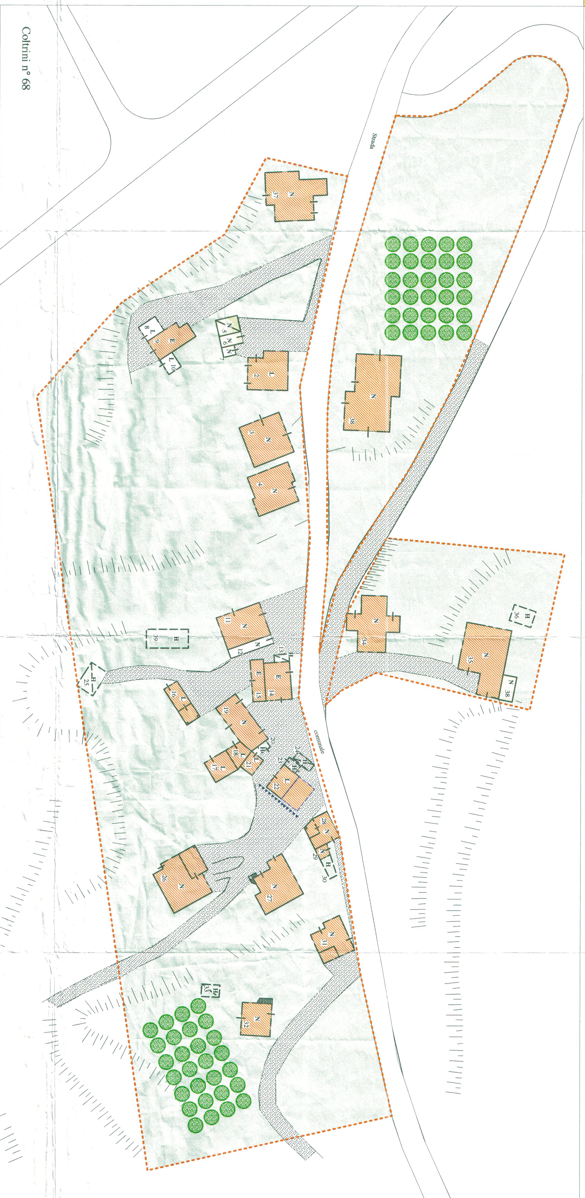
Coltini n° 68