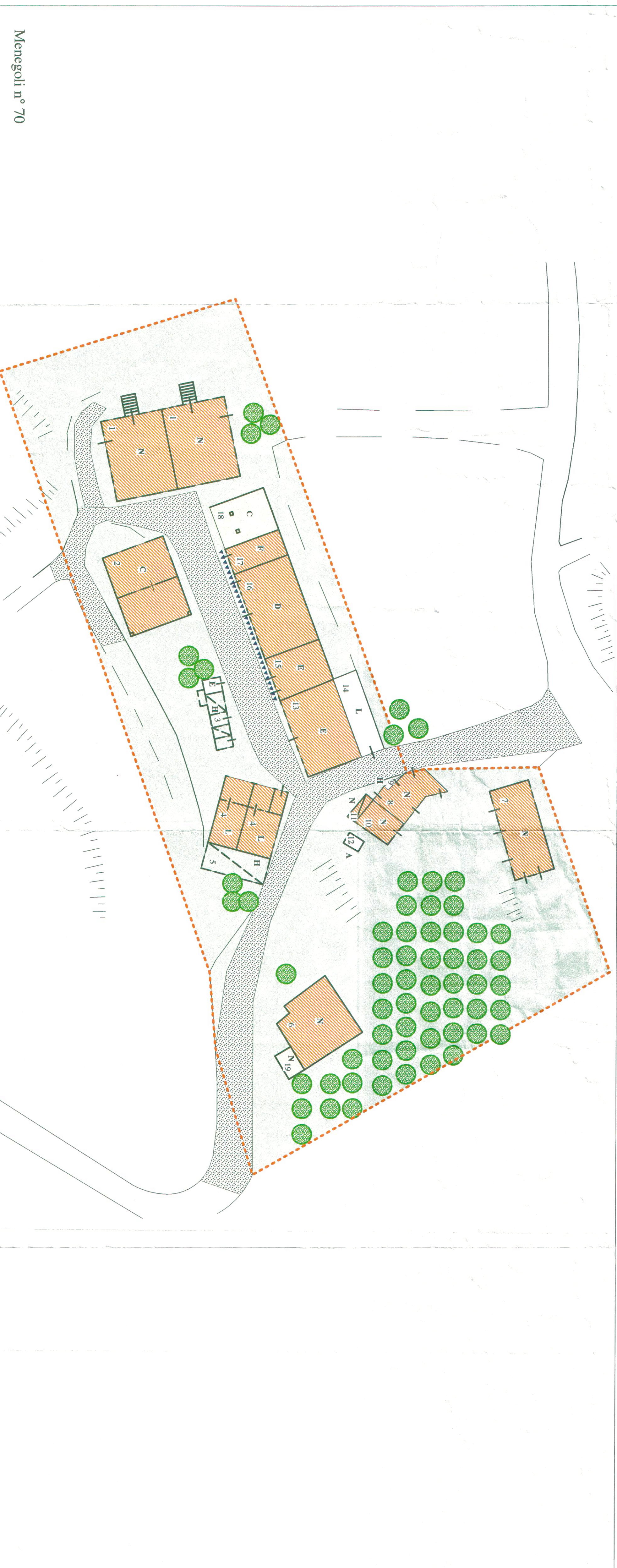
Monegoli n° 70