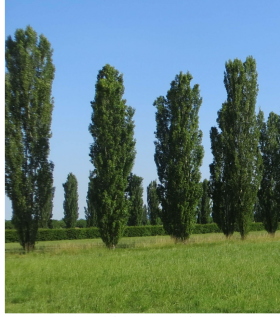
Populus nigra var. italica (pioppo cipressino)