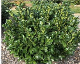
Prunus laurocerasus (lauroceraso)