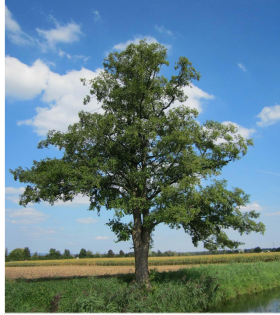
Alnus glutinosa (ontano nero o ontano comune)