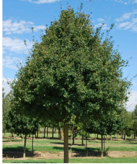
Acer campestre (acero campestre o acero oppio)