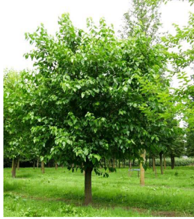
Morus alba (gelso bianco o moro bianco)