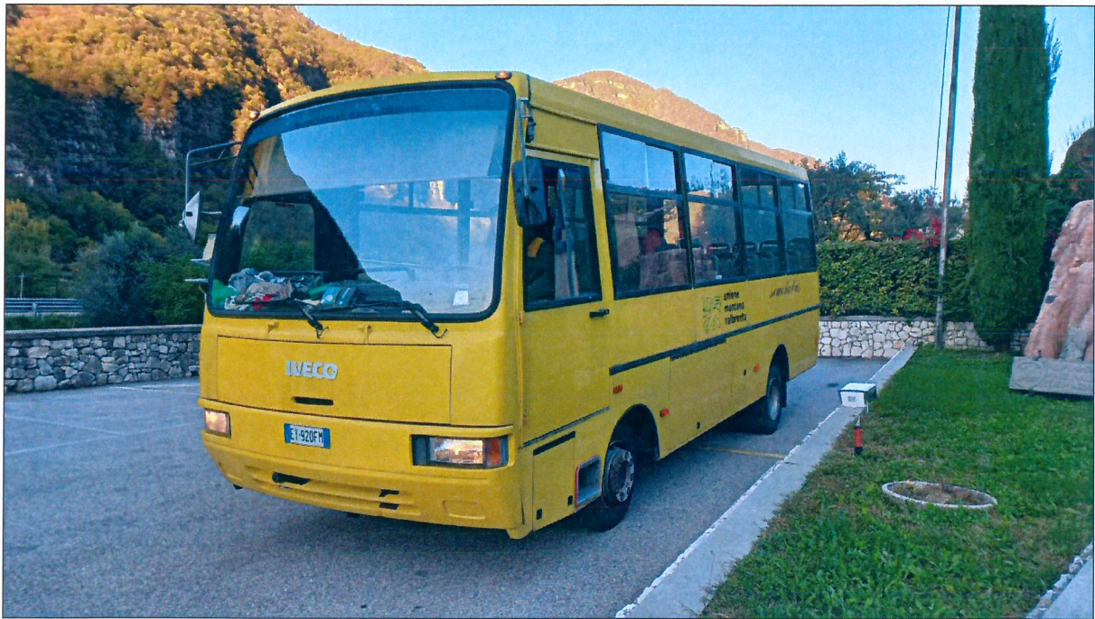
14) FIAT IVECO targato EY920FM – immatricolazione anno 1994