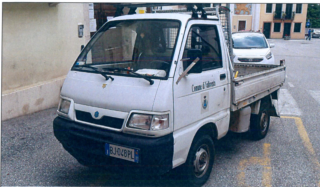
3) PIAGGIO S85LP BJ048PL – immatricolazione anno 2000