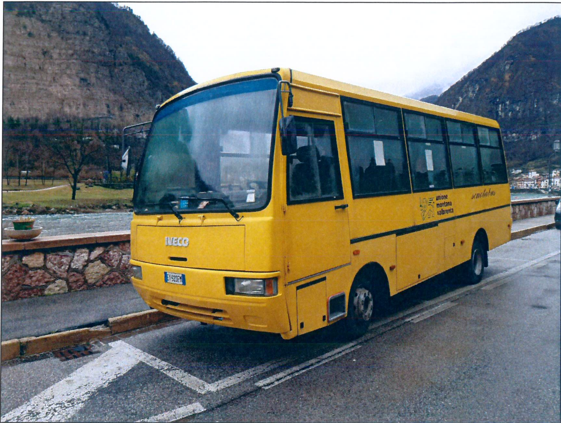
15) FIAT IVECO EY921FM – immatricolazione anno 1996