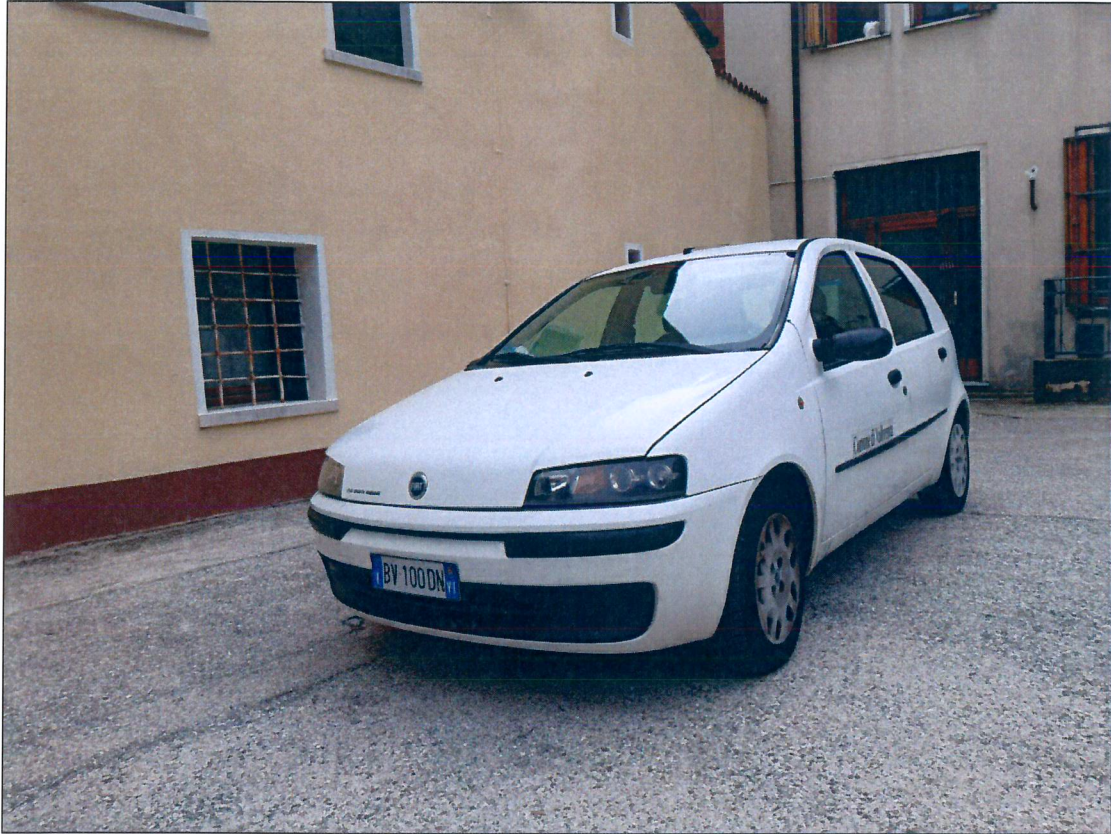
9) FIAT Punto BV100DN- immatricolazione anno 2001