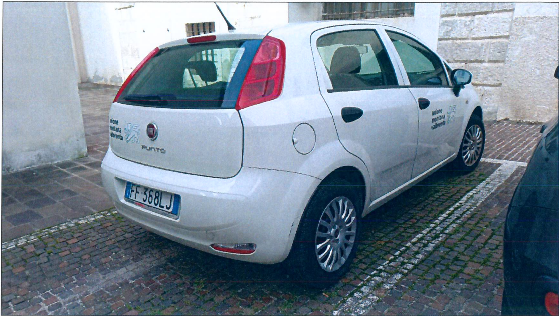
11) FIAT Punto FF368LJ– immatricolazione anno 2016