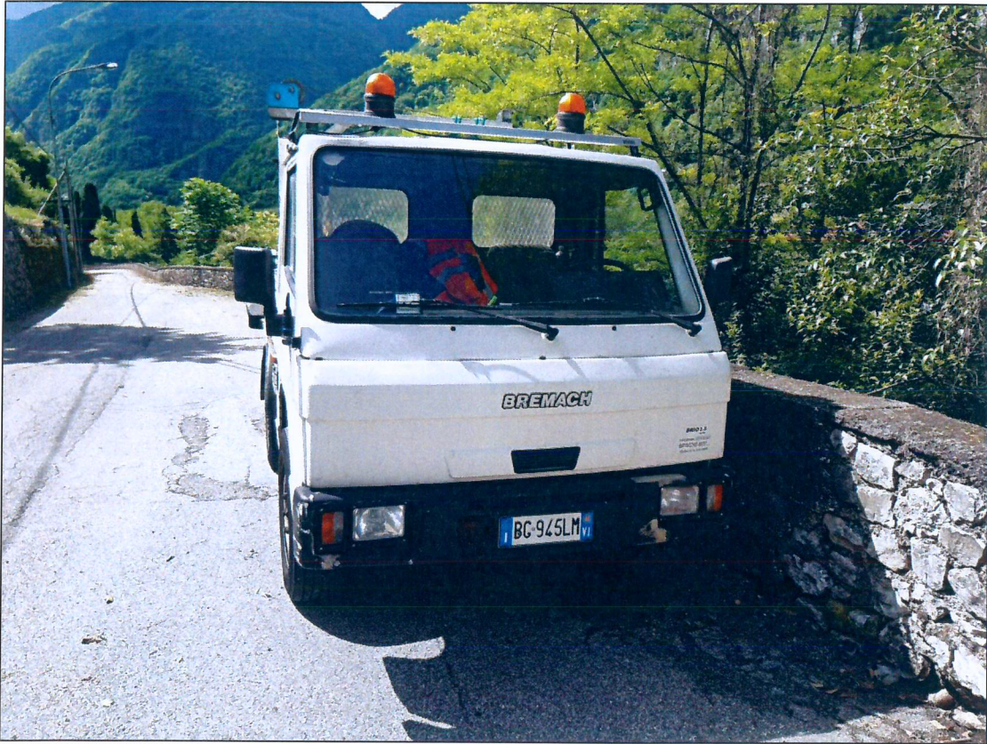
4) BREMACH TB35-E2 BG945LM – immatricolazione anno 2000