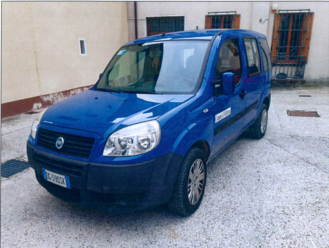
8) FIAT Doblò DG590SK – immatricolazione anno 2007