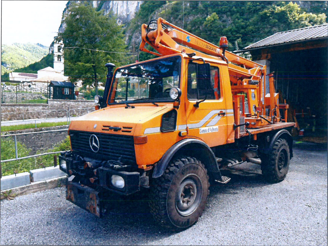
6) UNIMOG Mercedes AHZ779 – immatricolazione anno 1992 (con scala aerea mod Sequani)