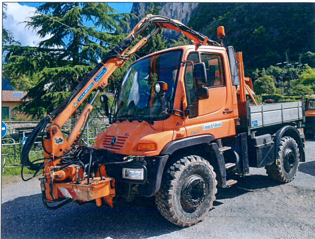
7) UMINOG U400 ALE 434 – 1° immatricolazione 2002 ( con braccio decigiatore mod. Mulag)