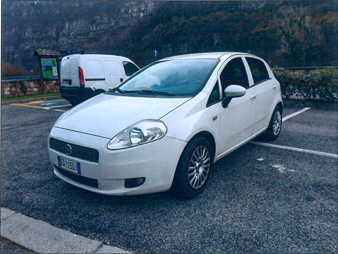
12) FIAT Grande Punto ED123DJ – immatricolazione anno 2010