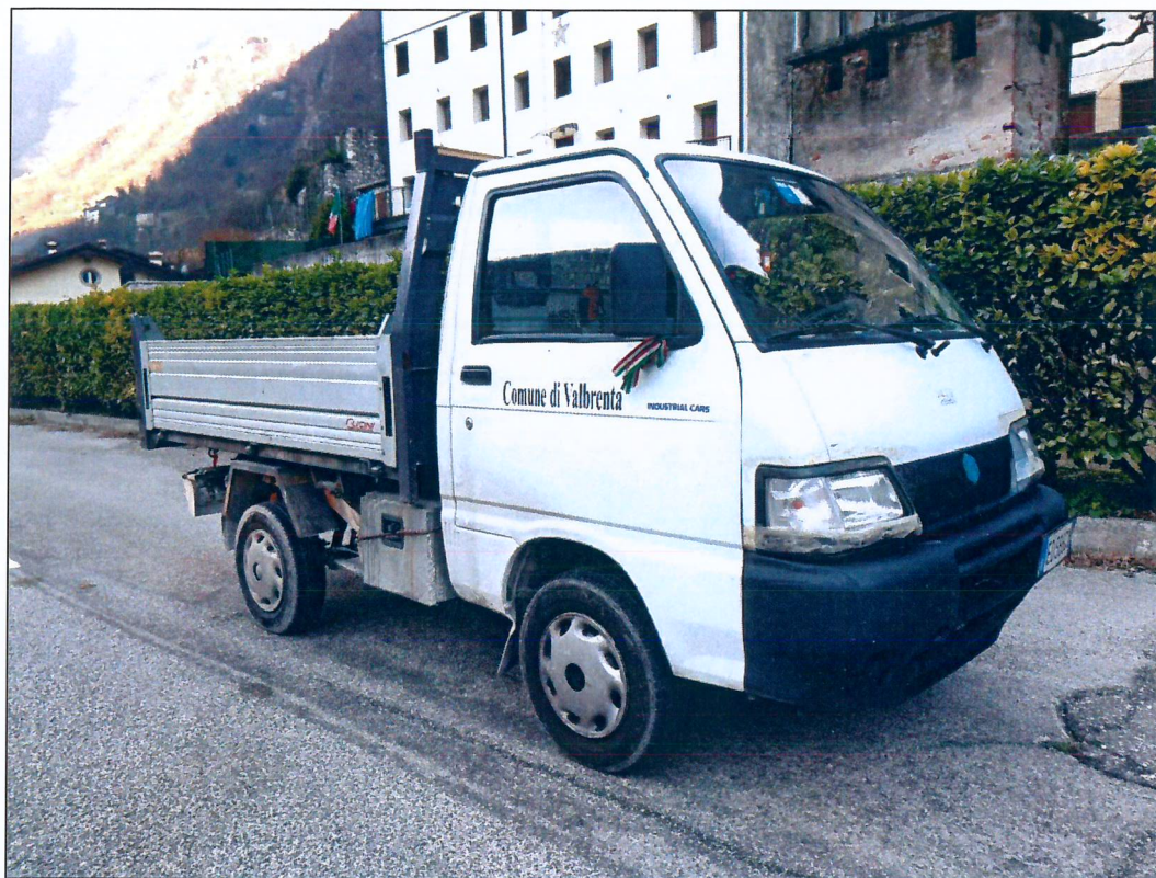
1) PIAGGIO Porter ED566GX – immatricolazione anno 2010