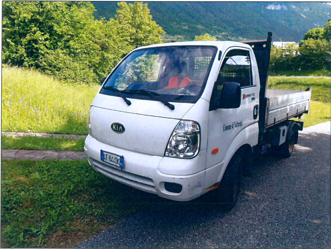
5) KIA SE CT844DK – immatricolazione anno 2005