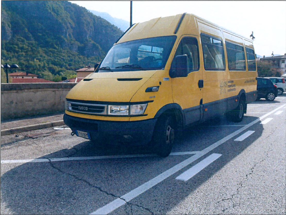
13) FIAT IVECO targato EY919FM – immatricolazione anno 2005