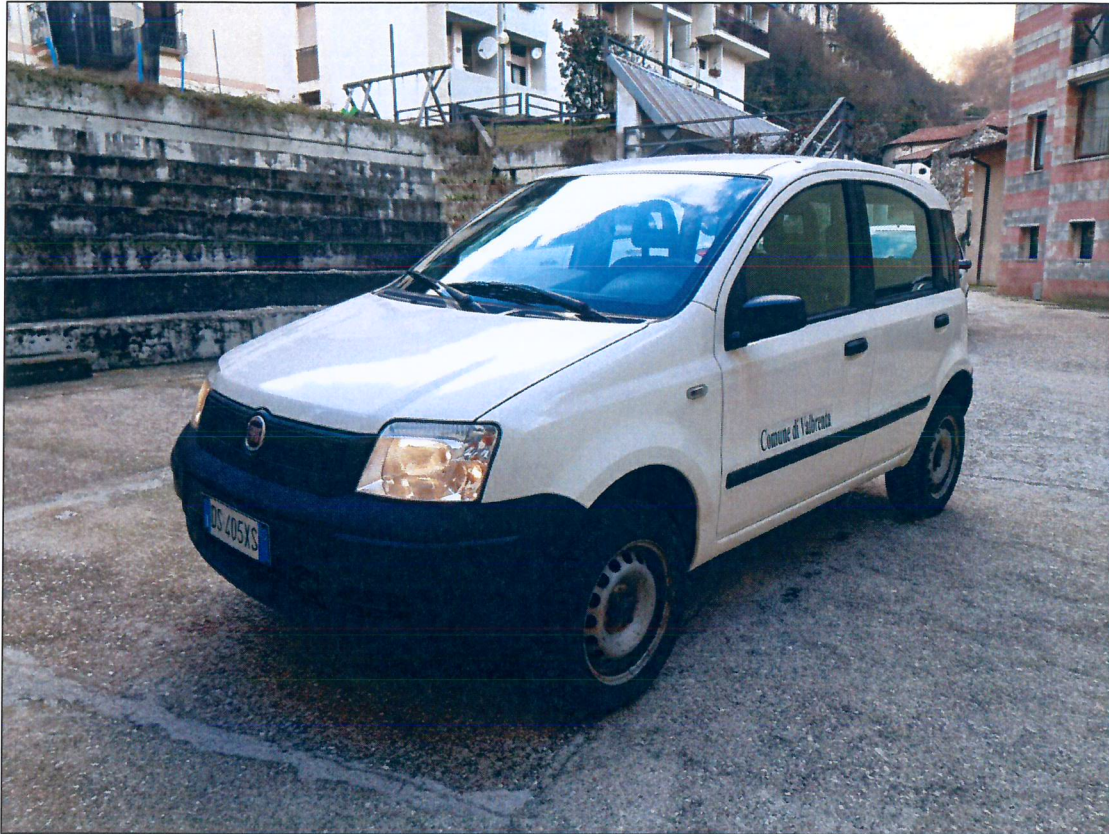
10) FIAT Panda 4x4 DS405XS – immatricolazione anno 2008