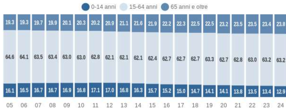
Struttura per età della popolazione (valori %) - ultimi 20 anni

COMUNE DI PIEVE DEL GRAPPA (TV) - Dati ISTAT al 1° gennaio - Elaborazione TUTTITALIA.IT