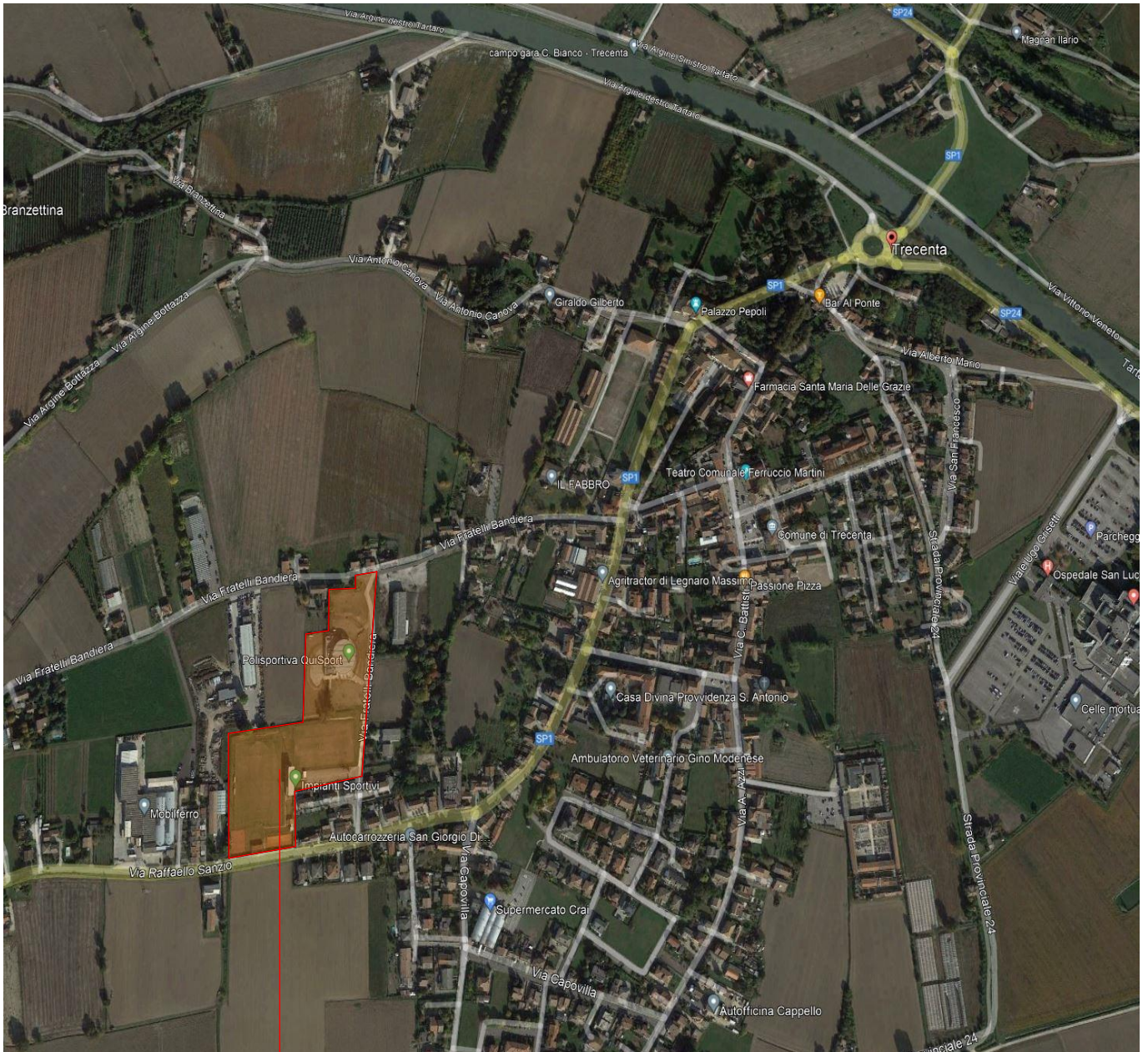
CITTADELLA DELLO SPORT DI TRECENTA. ACCESSI DA VIA FRATELLI BANDIERA E VIA RAFFAELLO SANZIO