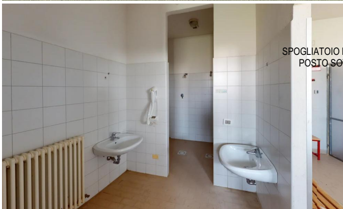
SPOGLIATOIO E ZONA DOCCE TIPO POSTO SOTTO LA TRIBUNA