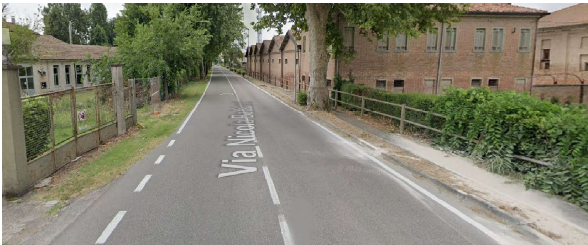
Vista di Via N. Badaloni/SP1