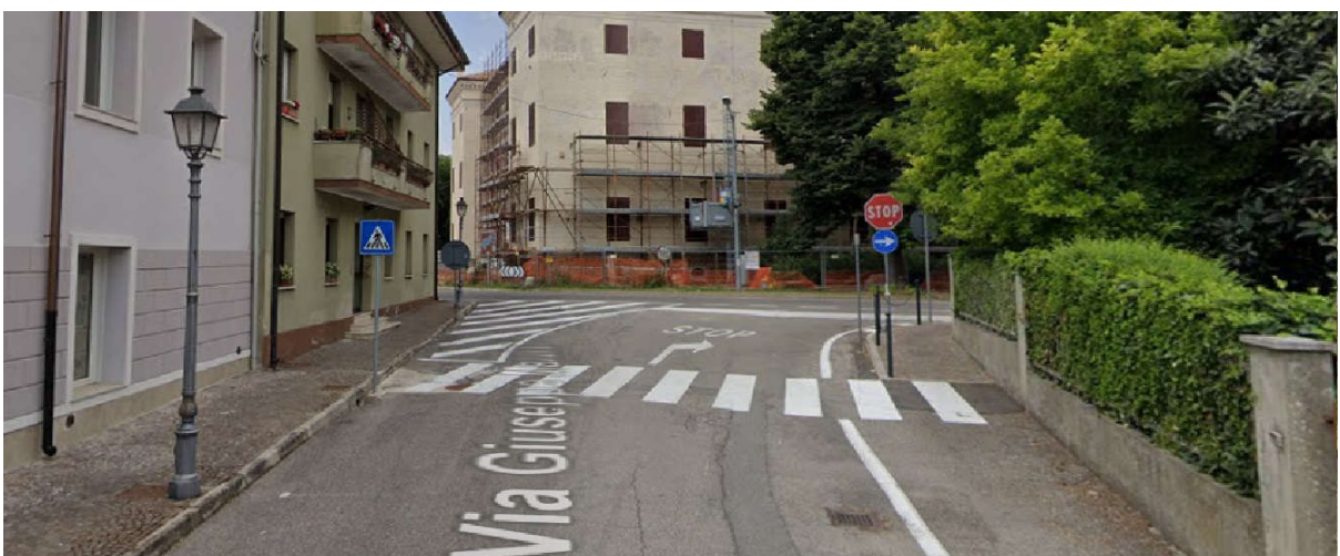
Vista senso unico di Via G.Mazzini su intersezione Via A.Manzoni-Via N.Badaloni/SP1