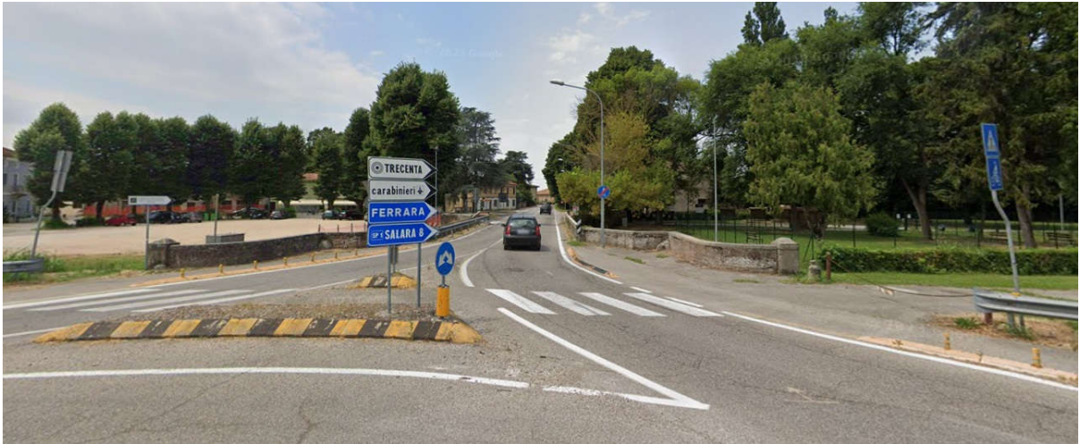
Vista ingresso al paese direttrice SP1-Via A. Manzoni