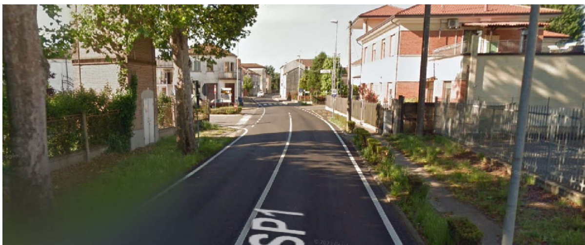
Vista di Via N. Badaloni/SP1 verso intersezione Via G. Resemini