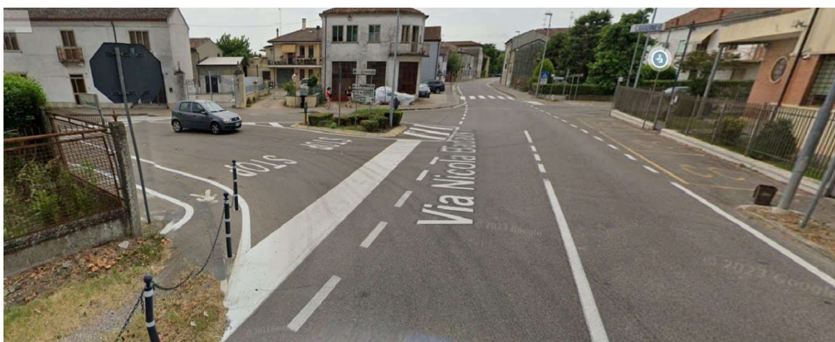
Vista intersezione di Via N. Badaloni/SP1 con Via G. Resemini