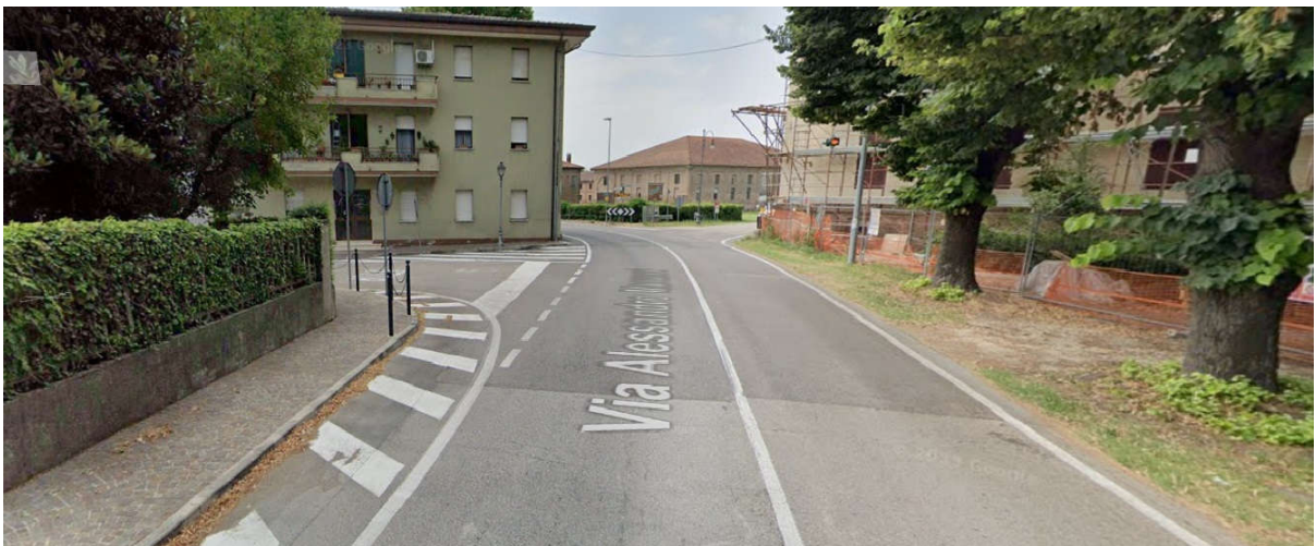
Vista intersezione Via A. Manzoni-SP1 e Via G. Mazzini