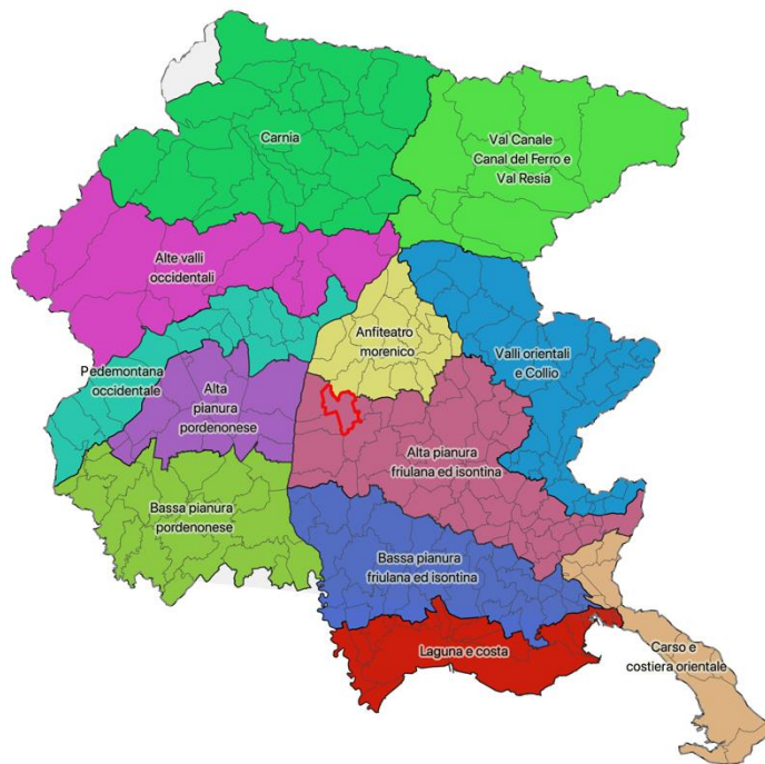
Figura 1-Ambiti di paesaggio e localizzazione del Comune di Coseano

Nella figura sottostante è apposto un perimetro rosso a individuare i limiti amministrativi del Comune di Coseano