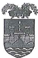
Provincia di Trieste