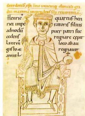
Indri IV Enrico IV

Il patriarca Sigerado com'è raffigurato nel Palazzo Arcivescovile di Udine.