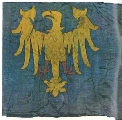
La bandiera dal patriarcato diventade la bandiera dal Friül. La bandiera del patriarca diventata la bandiera del Friuli.

Ai 3 di avrîl dal 1077 il patriarcato di Aquileia, Siart di Tengling, al ricêf a Pavia la investidure feudâl di bande di Indri IV, imperadôr todesc, che lu clame "Princeps Italiae et Imperii". In pratiche, in chel di al nas il Stât patriarcjâl furlan .